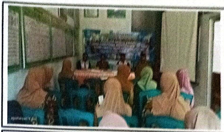
FOTO KEGIATAN PENINGKATAN KAPASITAS KADER KPM DAN KADER BIDANG POSYANDU DESA DESA KLATAKAN KECAMATAN KENDIT KABUPATEN SITUBONDO TAHUN ANGGARAN 2023