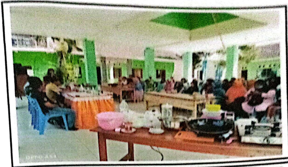
FOTO KEGIATAN PELAKSANAAN PELATIHAN PENGOLAHAN HASIL LAUT DESA KLATAKAN KECAMATAN KENDIT KABUPATEN SITUBONDO TAHUN ANGGARAN 2023