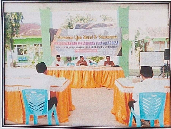
FOTO KEGIATAN PELAKSANAAN UJIAN MATERI DAN WAWANCARA PENJARINGAN DAN PENYARINGAN PERANGKAT DESA KLATAKAN DESA KLATAKAN KECAMATAN KENDIT KABUPATEN SITUBONDO TAHUN ANGGARAN 2023